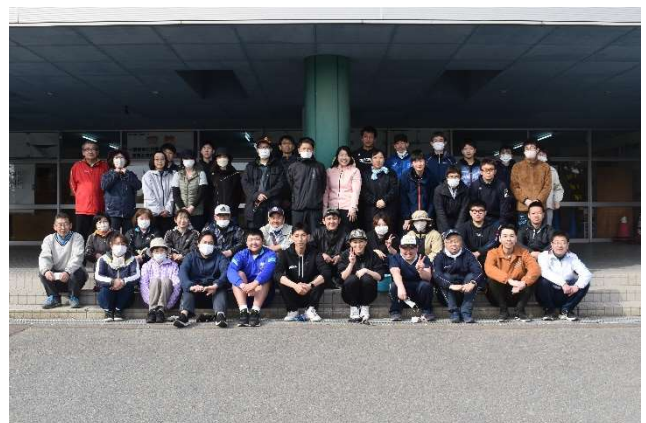
【PTA 厚生部による校舎周辺の環境整備】

行事や事業に協力していただいた方へのお茶代、会員の皆様への慶弔費、キャリア教育やインクルーシブ代として昨年度は個別の支援が必要な生徒のために全教室にタイムタイマーを設置させていただきました。また、会員の皆様にお配りする文書に使うコピー用紙の購入や地域奉仕活動にご協力いただく地域の方への文書を配付する郵送代などの事務費としても使わせていただいております。